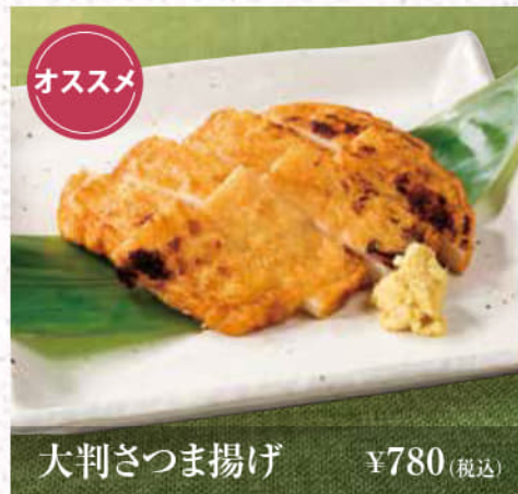
大判さつま揚げ ¥780(税込)