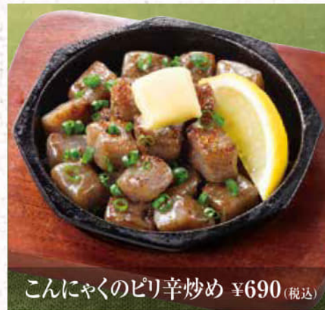
こんにゃくのピリ辛炒め ¥690(税込)