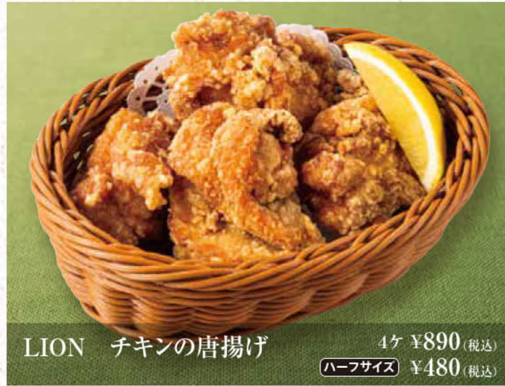
LION チキンの唐揚げ 4ヶ ¥890(税込) ハーフサイズ ¥480(税込)