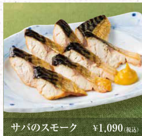
サバのスマーク ¥1,090(税込)