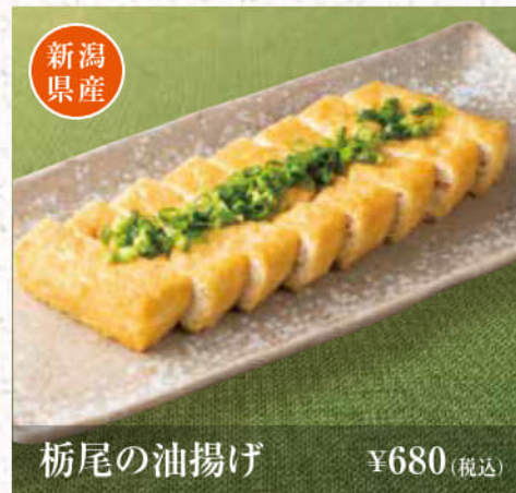
栃尾の油揚げ ¥680(税込)