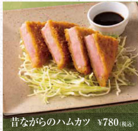
昔ながらのハムカツ ¥780(税込)