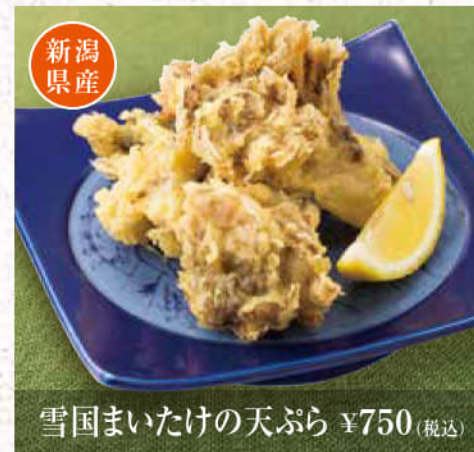
雪国まいたけの天ぷら ¥750(税込)