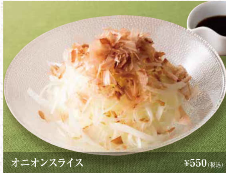
オニオンライス ¥550(税込)