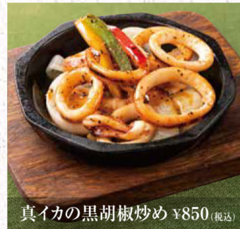
真イカの黒胡椒炒め ¥850(税込)