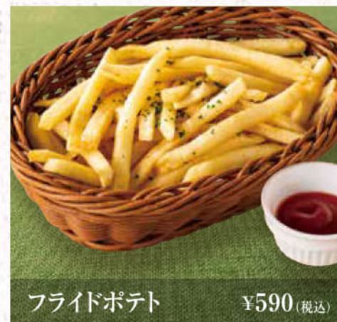
フライドポテト ¥590(税込)